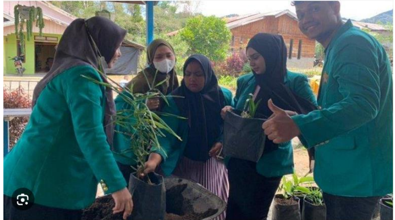
Mahasiswa KKN USK 'Sulap' Lahan Kosong jadi Taman Obat di Bener Meriah - Serambinews.com